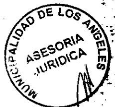
ESTEBAN KRAUSE SALAZAR ALCALDE ILUSTRE MUNICIPALIDAD DE LOS ANGELES