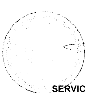
SANDRA VEGA GONZÁLEZ DIRECTORA NACIONAL (S) SERVICIO NACIONAL PARA LA PREVENCIÓN Y REHABILITACIÓN DEL CONSUMO DE DROGAS Y ALCOHOL, SENDA

ANÓTESE, REFRÉNDESE, COMUNÍQUESE y PUBLÍQUESE A TRAVÉS DEL PORTAL www.mercadopublico.cl