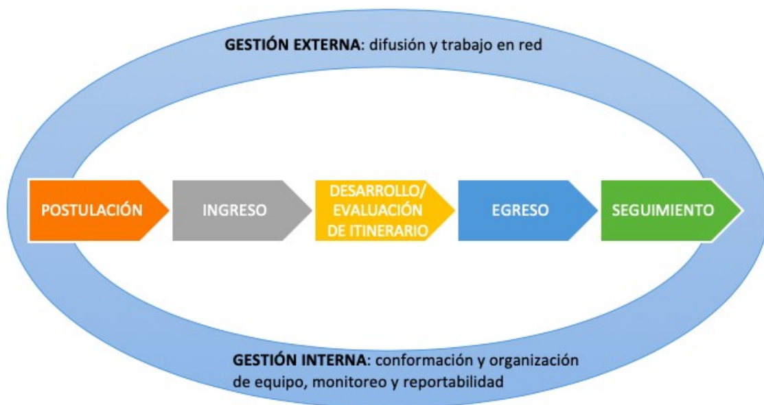
Diagrama 8: Esquema del proceso de ejecución VAIS

El ámbito de Gestión Organizacional , se componen de elementos de gestión externa tales como; la difusión y el trabajo en red. Y de gestión interna, donde están elementos relacionados a la conformación y organización del equipo, monitoreo y reportabilidad.